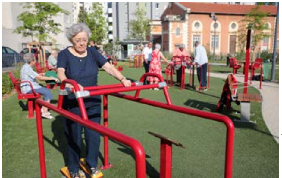
Photo 1 - Le « Physio Parc » en cours d'expérimentation à Saint-Étienne