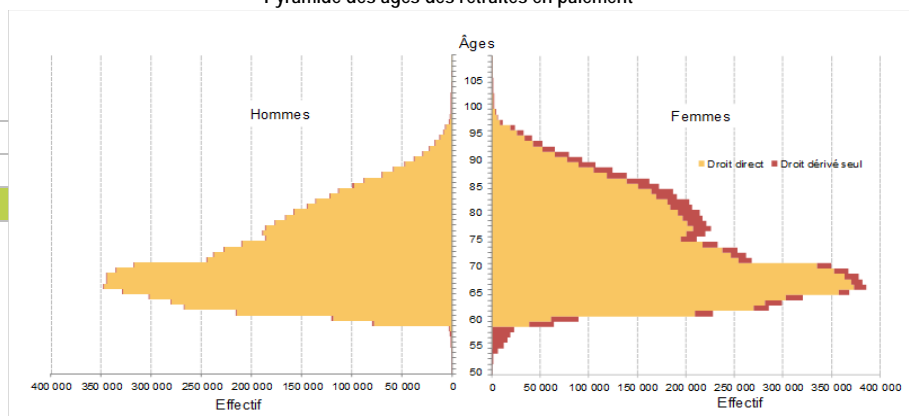
Pyramide des âges des retraités en paiement